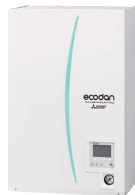
Тепловые насосы (наружные агрегаты)